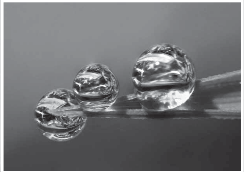
Svet v malem – rosa.