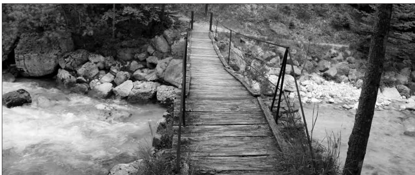
Sožitje narave in človeka.