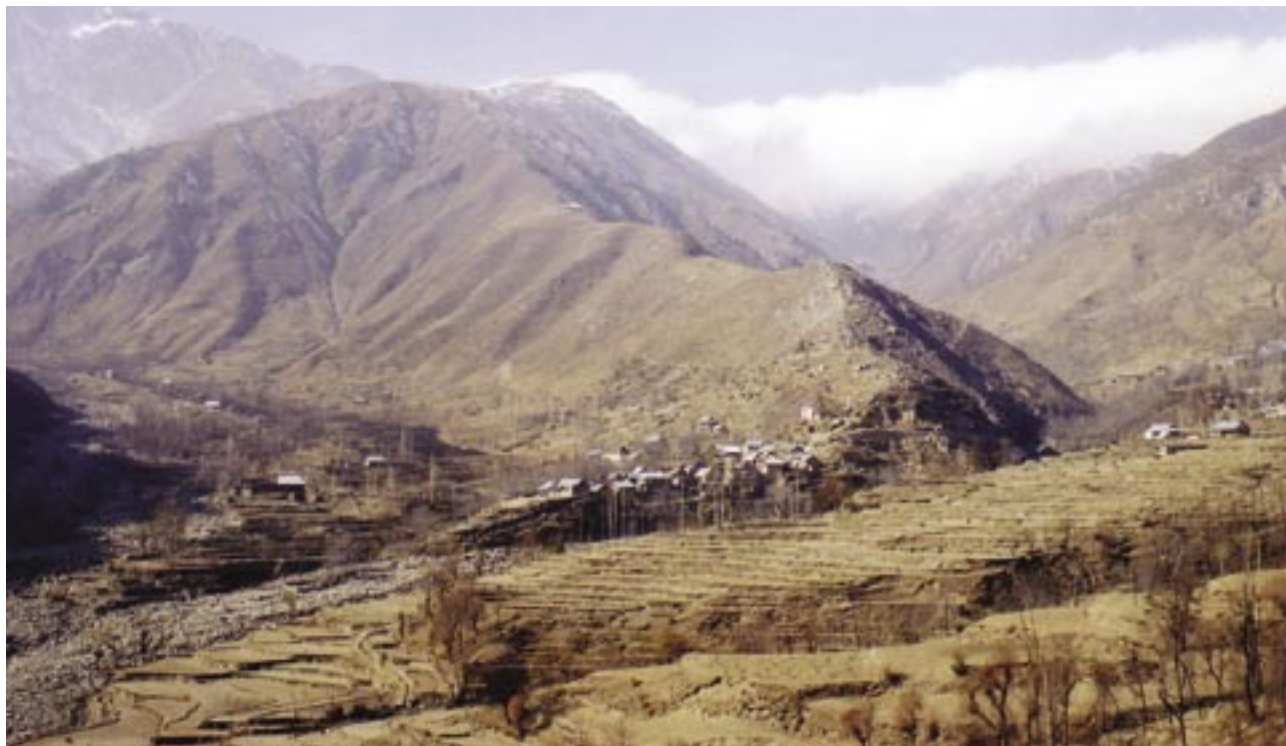
Slika 5: Gorstvo Pir Pandžal obdaja Kašmirsko dolino na jugu in preprečuje vdor vlažnega monsuna. Preden so Indijci zgradili tunel Banihal, je bila Kašmirska dolina v zimskem času več mesecev odrezana od Indije.

Pol stoletja trajajoče reševanje kašmirskega vprašanja do danes ni prineslo trajnejše rešitve. Zaradi mnogokrat prikritih dejstev in neresnic, ki so jih politiki in mediji ponujali ljudstvu tako na eni in drugi strani, je odstopanje od zavzetih stališč vse težje. Čeprav bodo morale pri reševanju kašmirskega vprašanja sodelovati vse tri vpletene strani, pa ima pri dokončni rešitvi konflikta najpomembnejšo vlogo Indija. Če Indija v sodelovanju z ostalimi ne bo mogla najti trajne rešitve, so lahko posledice za prihodnost podceline pogubne.