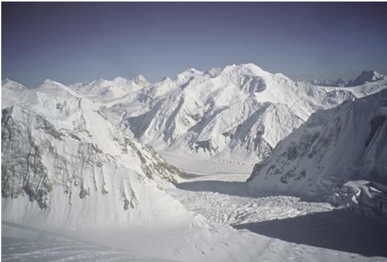
Slika 4: Pogled na širše območje najvišjega bojišča na svetu, na meji med Pakistanom in Indijo. Vojaške postojanke so stalno oskrbovane vse do nadmorske višine 6000 m.

Pakistan je bil vključen v vzpodbujanje, ustanavljanje in oskrbovanje uporniških enot na indijski strani meje, vendar pa je bilo za tako hiter porast aktivnosti krivo tudi ravnanje indijske vojske. V devetdesetih letih 20. stoletja je splošna politična situacija v Indiji pripeljala do porasta nemirov v Kašmirju. Uničenje mošeje Babri Masdžid v Ajodhiji, ki naj bi stala na mestu, kjer je bil nekoč tempelj boga Rame, je povzročilo številne muslimanske napade in bombne eksplozije. K nemiru je prispeval tudi ukrep indijske vlade, po katerem so imeli pripadniki muslimanske veroizpovedi veliko slabše možnosti za zaposlitev (15).