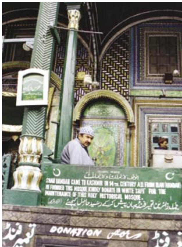
Slika 1: Vhod v mošejo v Šrinagarju, ki hrani posmrtno ostanke Šaha Hamdana. Prvi muslimanski napad na Kašmir se je zgodil že v 10. stoletju. Kasneje so muslimanske čete občasno pustošile te kraje, a nikoli zavzele. V 14. stoletju je sufijsko različico islama v Kašmirski dolini razširil iranski Šah Hamadan, vendar se je islam dokončno uveljavil šele v 16. stoletju.

V Kašmirju je bilo tedaj okrog 80 % prebivalstva muslimanskega, medtem ko je bil maharadža Hari Singh Hindujec, gospodarsko pa je bil tesno navezan na Indijo. Britanci so pritiskali na maharadžo, naj se odloči za eno ali drugo stran. Na papirju je bila odločitev enostavna, saj je bil Pakistan edina naravna in kulturno-civilizacijska alternativa. Do 15. avgusta 1947, roka odločitve, je maharadža Hari Singh okleval. Svoje dežele in oblasti ni hotel predati nikomur, toda njegovi večinoma muslimanski podaniki so zahtevali, naj deželo izroči Pakistanu. Hari Singh se je zavzemal za samostojno državo, kar pa je bilo v tistem obdobju bolj iluzija kot realna politična možnost (16).