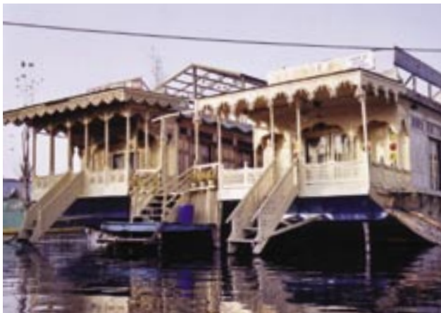
Slika 6: Plavajoče hiše na jezeru Dal od pričetka spopadov samejajo in čakajo na ponovni prihod turistov. Pred letom 1989 je bil Kašmir izrazito turistična dežela, ki ga je letno obiskalo več kot pol milijona turistov. Razkošne plavajoče hiše na jezeru Dal so dediščina Britancev, gradili pa so jih po vzoru skromnejših tradicionalnih dongov.

Številni poznavalci razmer v Kašmirju so mnenja, da bi rešitev prinesel dialog med vsemi tremi vpletenimi stranmi. Reševanje tega ključnega vprašanja vidijo bodisi v uresničitvi resolucije OZN o plebiscitu ali v pogajanjih med vlado Indije, Pakistana in zvezne države Džamu in Kašmir. Na zadnjih parlamentarnih volitvah izvoljeni predsednik vlade Džamuja in Kašmirja, Mufti Mohammad Sayeed, je vladi iz New Delhija predlagal sveženj zakonov o avtonomiji, ki jih je nekoč s pogajanja dosegel Šejk Abdulah, oče Kašmircev. Avtonomija bi zvezni državi Džamu in Kašmir zagotovila samostojno odločanje v skoraj vseh upravnih zadevah, razen pri obrambi, varnosti in zunanji politiki (2). Mnogi se navdušujejo za spremembo statusa